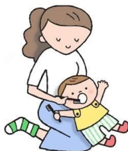
仕上げ磨きをする