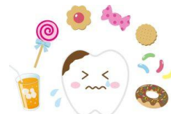
甘い物のとりすぎに注意