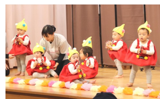
ひよこ組 「おもちゃのチャチャチャ」