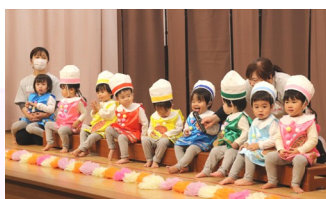
たんぽぽ組「パンパンたいそう」